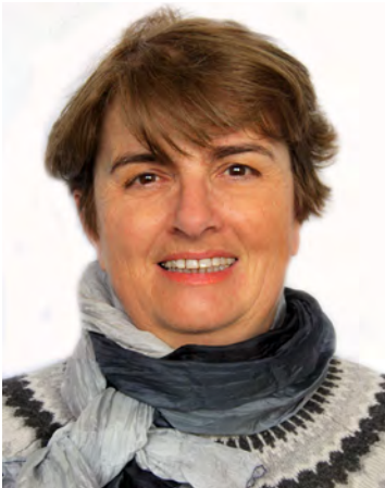
Armelle Deschard © DR

Louis comme l'indiquent encore certaines références. Nous avons son portrait et bien des traces de l'ouvrage. En ce début du XVII e siècle, scientifiques et intellectuels ont pu se libérer de l'emprise du latin et le titre comme l'ouvrage est en français. Le mot est un composé : œno- renvoie au vin en grec ancien, οἶνος et -logie installe le mot dans la lignée des discours, traités et sciences. Conformément à sa formation, l'œnologie dans ce titre est bien un « discours sur le vin », « un traité sur le vin ». Le mot se diffuse lentement, principalement dans les ouvrages techniques. Le sens s'élargit et devient « science ou technique du vin ». Les attestations relativement significatives sont du début du XIX e siècle. Le mot n'apparaît que dans la 6 e édition du Dictionnaire de l'Académie Française (1835), avec comme sens « art de faire le vin », « traité sur le vin ».