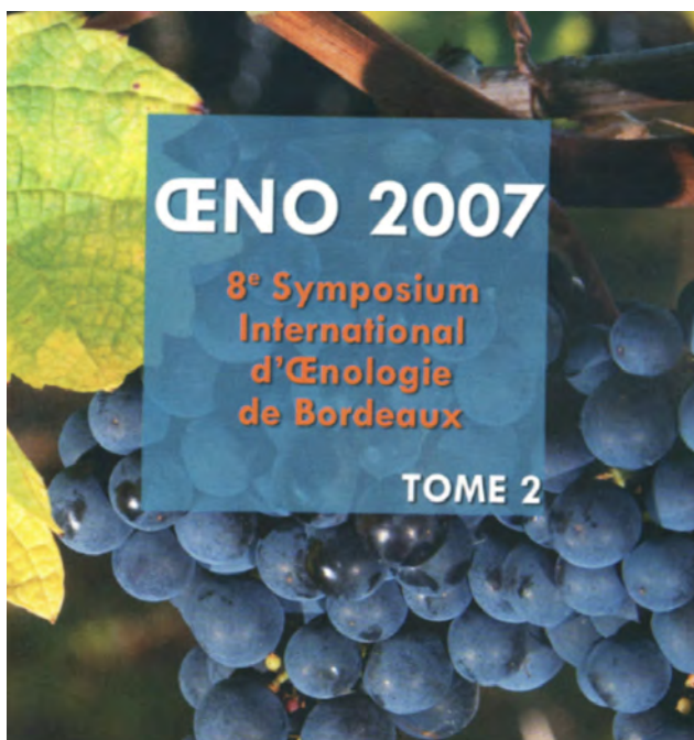
Figure 2. Couverture des Actes du 8 e Symposium International d'œnologie de Bordeaux, œNo 2007. Faculté d'œnologie, Université Victor Segalen Bordeaux 2.

L'actuelle prononciation courante est finalement deux fois fautive. Elle confond graphème et phonème, d'une part et calque ce qu'on entend ou ce qu'on dit sur ce qu'on voit ou plutôt croit voir d'autre part. Car enfin, elle ne distingue pas ce qu'on écrit œ et ce qu'on écrit œu. Dans le cas des mots où apparaît ce dernier graphème complexe (3 éléments) on a raison de dire [œ] comme bœuf [bœf], plur. [bø] car cette fois-ci s'ajoute à la ligature connue un -u-. La graphie complexe tente de rendre compte d'une histoire, un phonème vocalique complexe apparu vers le XIII e siècle en français. Cette confusion a pu provoquer un phénomène qui approche de ce qu'on nomme l'hypercorrection, c'est-à-dire la tendance des locuteurs à corriger plus qu'il ne faudrait leur graphie, leur prononciation ou leur syntaxe, en collant davantage à ce qu'ils croient être l'étymologie. Il y a donc dans la prononciation fautive actuelle une marque de beaucoup de bonne volonté et une erreur patente.